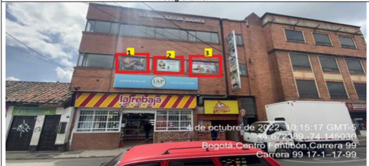
Fotografía No. 4

En la cual se evidencian tres (3) elementos PEV, pertenecientes a la sociedad INSTITUTO ARGENTINO DE PELUQUERÍA Y BELLEZA COLOMBIA S.A.S, los cuales se encuentran incorporados en las ventanas de la edificación y son adicionales al único elemento permitido por fachada de establecimiento.